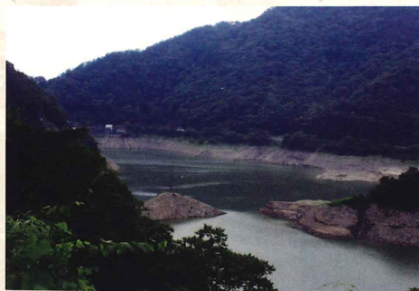
刀利ダム湖(渇水期)