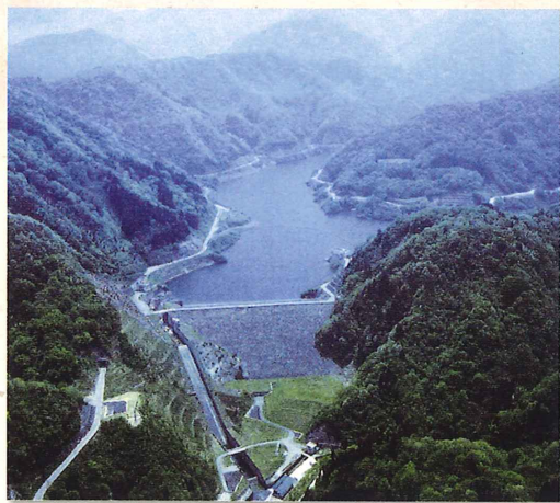
白中ダム(ロックフィルダム)

ダムによって出来た湖は、29.5haで、総貯水量は6,950千m 3 になり、その内利用できる有効貯水量は、6,070千m 3 で、この分を使って灌漑や、洪水調整が行われています。