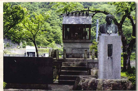
刀利ダム記念公園