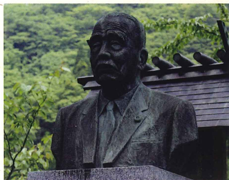
松村謙三銅像(刀利ダム)

小矢部川を上流へさかのぼると、石川県の県境近くに、雄大な「刀利ダム」が姿を現す。これは小矢部川唯一のロックフィル式ダムで、昭和42年(1967年)に完成したものである。このダムの傍らには、「松村謙三」の銅像(胸像)が建立されている。