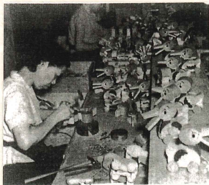
太平木工 玩具の製作状況

昭和25年度には、「株式会社波多製作所」が大きく成長し野球バッド、スキー、テニスラケット、バドミントンラケットなどの木製品の生産が、全国生産の7割を占めるまで成長した。