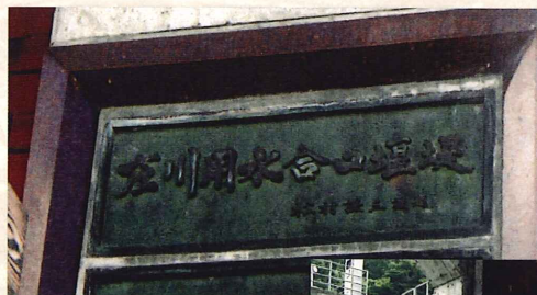
庄川合口ダムの謙三の碑文

今や庄川の天与の恩恵を受けるわれわれは、 永遠にこの偉業を讃え、共栄の道を歩みたい。