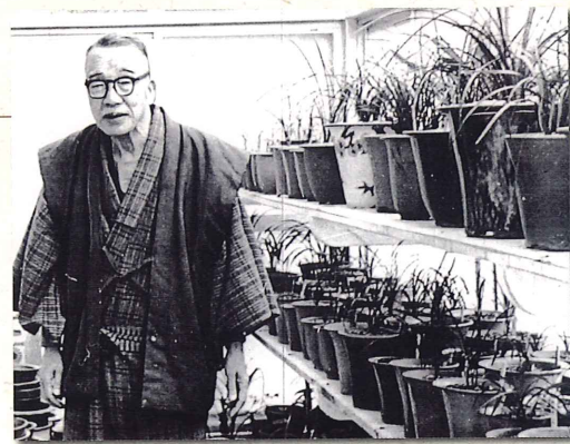
松村先生と中国蘭

内外の厳しい情勢にもかかわらず、両国の貿易が再開され、新聞記者の相互の常駐等が実現したのも、松村と周恩来の間に培われた友誼(ゆうぎ)がもたらしたものであった。