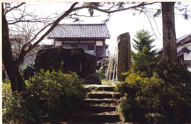
農地改革記念碑(福光町中央公園)

これを受けて、政府は1946年(昭和21年)10月、第二次農地改革を決め実施したのです。この結果、自分の農地を耕す自作農が一気に増加したのです。