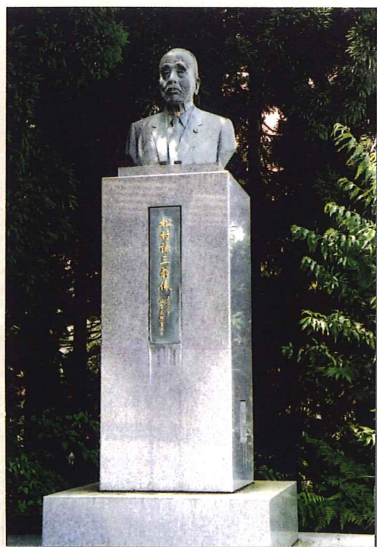
松村謙三銅像(刀利ダム)

ことに用水の落差を利用し、発電を行うことは当時として画期的な大事業であり、幸いに、国、県などの助成を得て、昭和5年起工式を挙げ、同16年堰堤を完成し、その他関連施設を含む県営事業として、17か年の歳月と総工費390余万円を投じ、灌漑面積12,000ヘクタールに及ぶ壮挙は全く成り、宿年の大成は成就された。