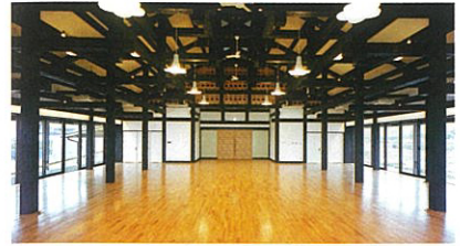
■ 多目的ホール 様々なイベントや、展示会などを予定しております。 ギャラリーとしてもお使いいただけます。