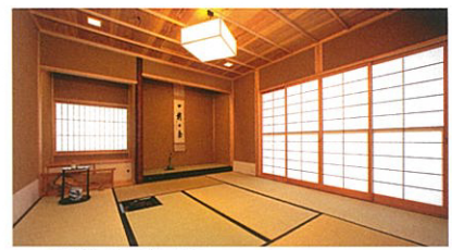
■ 研修棟（茶室） 落ち着いた純和風の造りとなっており、茶席、ギャラリー としても広くお使いいただけます。