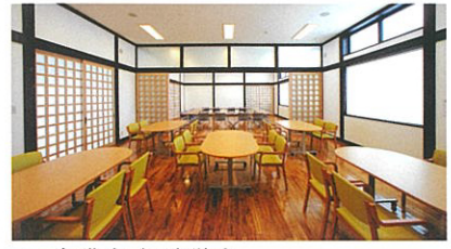
■ 会議室・視聴覚室 会議やイベント・展示会などにお使いいただけます。 隣には図書コーナーも設けてあります。