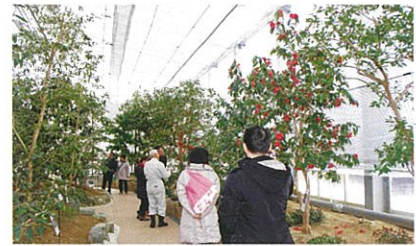
原種椿園「桐野秋豊コレクション」

原種椿園は、中国、ベトナムのツバキ属原種約100 種を植栽した国内有数の施設で あります。特に黄色のツバキ属は 極めて珍しく貴重種です。