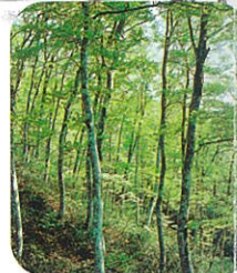
赤祖父山のブナ林

赤祖父山（標高1,013m）に 自生するブナの原生林は、平成 7年に林野庁長官より「全国 水資源百選」の1つとして認定 されています。