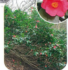
大ユキバツツバキ

ユキツバキをはじめ、園芸種 を含めて約200種、約500本 もの椿が植栽されています。 自生するユキバツツバキの 群生地も広がっています。